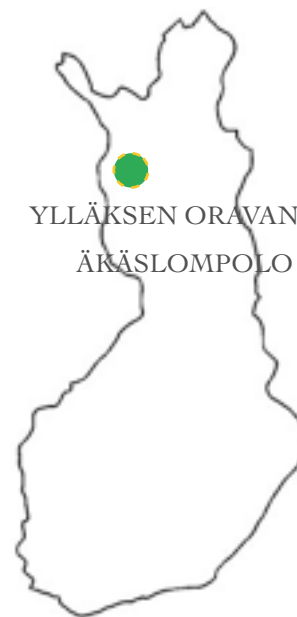
YLLÄXSEN ORAVANPESÄT ÄKÄSLOMPOLO

Vid slutet av vistelsen får alla ett "Fjälläventyrarens pass".